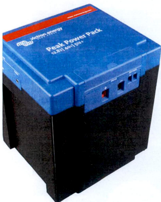
De grootste broer met een capaciteit van 42,67 Ah kan langer energie leveren.

TEKST: ROLF DE ZWART