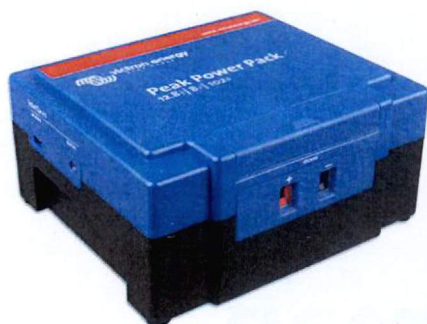
De kleinste Peak Power Pack-telg uit de serie: goed voor 102 wattuur. Dat is 102 Wh:12 V = 8,5 Ah-capaciteit.